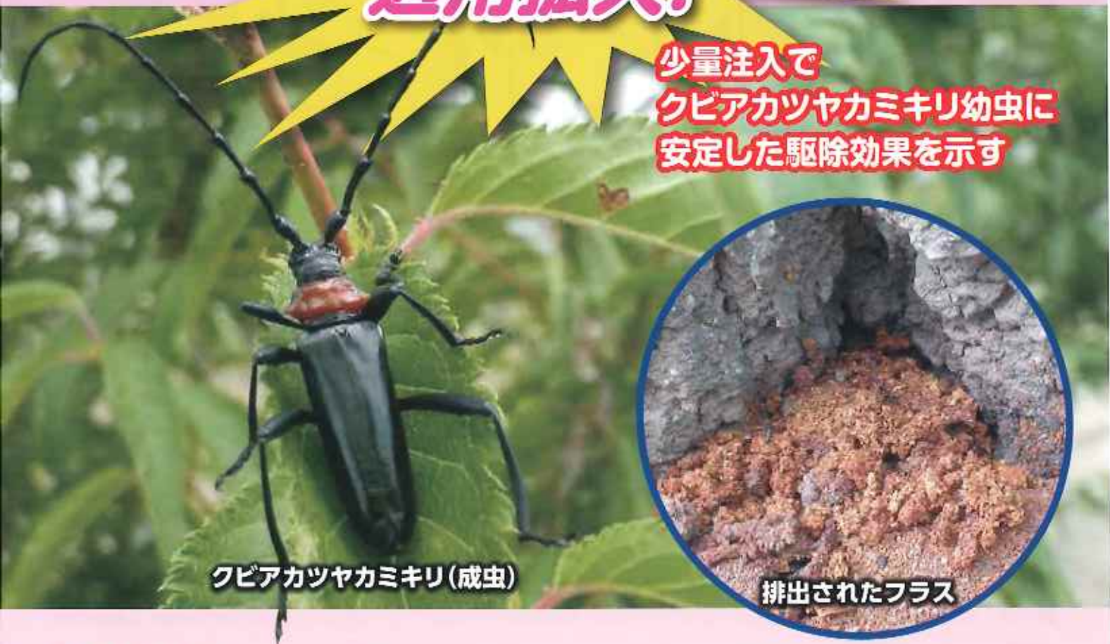
クビアカツヤカミキリ(成虫)