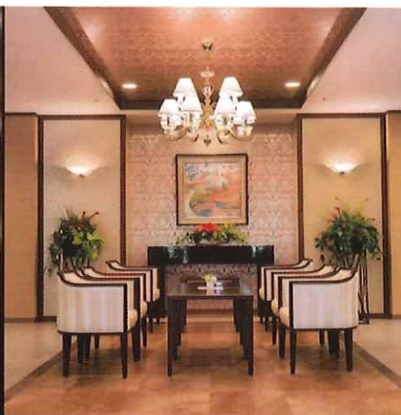
介護付きホーム SOMPOケア ラヴィーレ