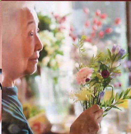
サービス付き高齢者向け住宅 SOMPOケア そんぽの家S