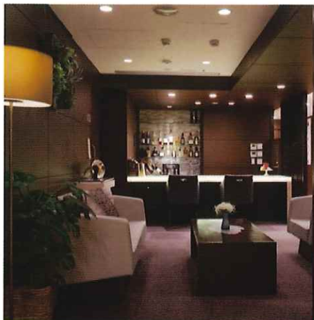
介護付きホーム SOMPOケア ラヴィーレグラン

より自由な暮らしを楽しみたい方も、よりきめ細かなケアをお求めのかたも それぞれが求める暮らし方に、幅広い空間とサービスでお答えします。