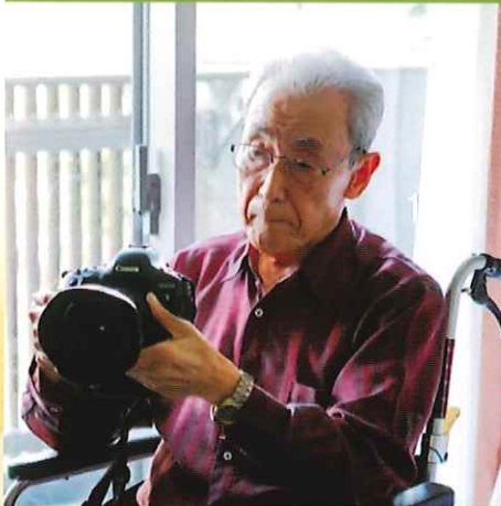
介護付きホーム SOMPOケア そんぽの家